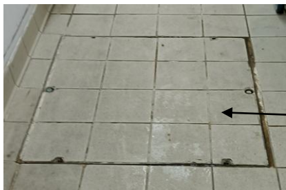
Exemple d'un regard à traiter