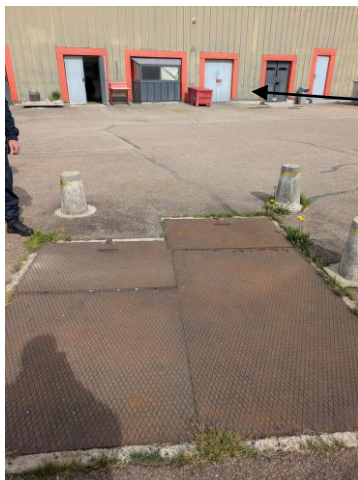
Ensemble des portes donnant sur la cour technique à repeindre

Reprise des cadres de portes en cuisine compris passivation (Qté : 12)